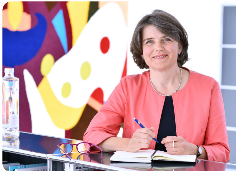
Kathrin Schweizer Regierungsrätin Basel-Landschaft, Vorsteherin der Sicherheitsdirektion

Waren Sie schon mal in einem Land, in dem Sie die Sprache nicht beherrschten? Man fühlt sich dabei doch recht unsicher und verloren. Daher sind auch Deutschkenntnisse in unserer Region von zentraler Bedeutung, um Orientierung, Integration und Teilhabe zu fördern. Ich bin froh, können wir auf das K5 zählen, das die Menschen umfassend in unterschiedlichen Lebenslagen – ob mit Familienpflichten oder klaren Berufswünschen – unterstützt. Dabei stellt es spürbar die Personen, ihre individuellen Geschichten und ihre nachhaltige Integration in der Schweiz ins Zentrum seiner Bemühungen.